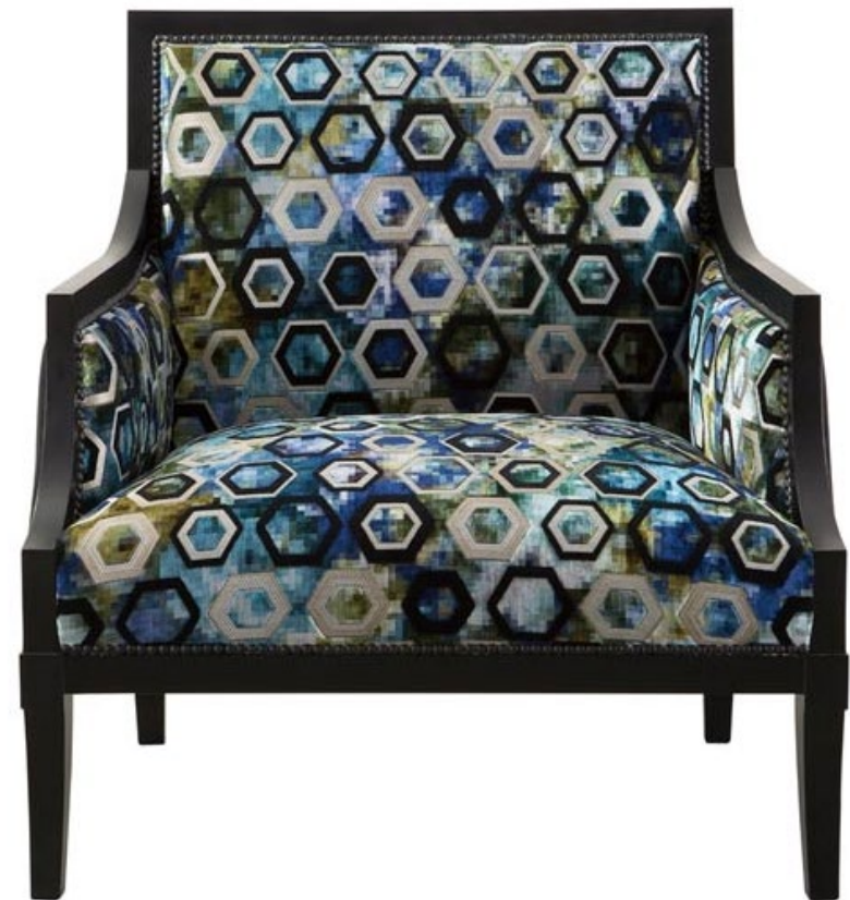
Marquise – Marquise Armchair – Marquise Sillon