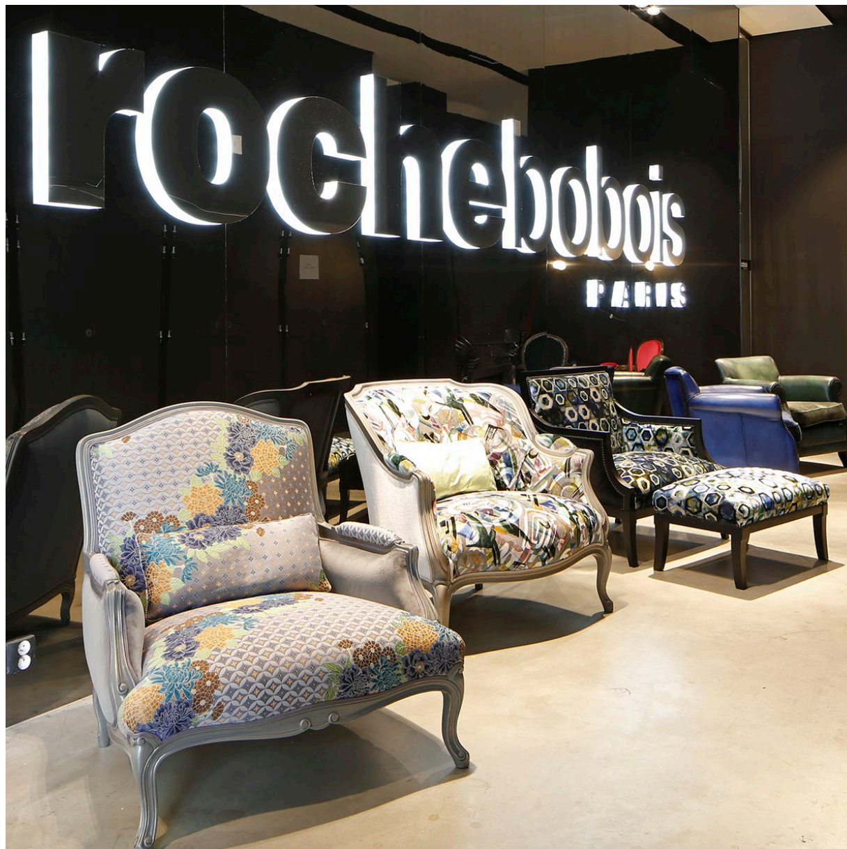
Marquise – Marquise Armchair – Marquise Sillon