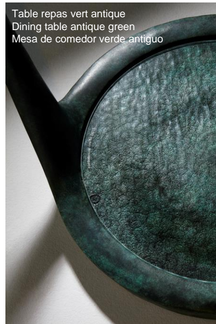
Table repas vert antique Dining table antique green Mesa de comedor verde antiguo