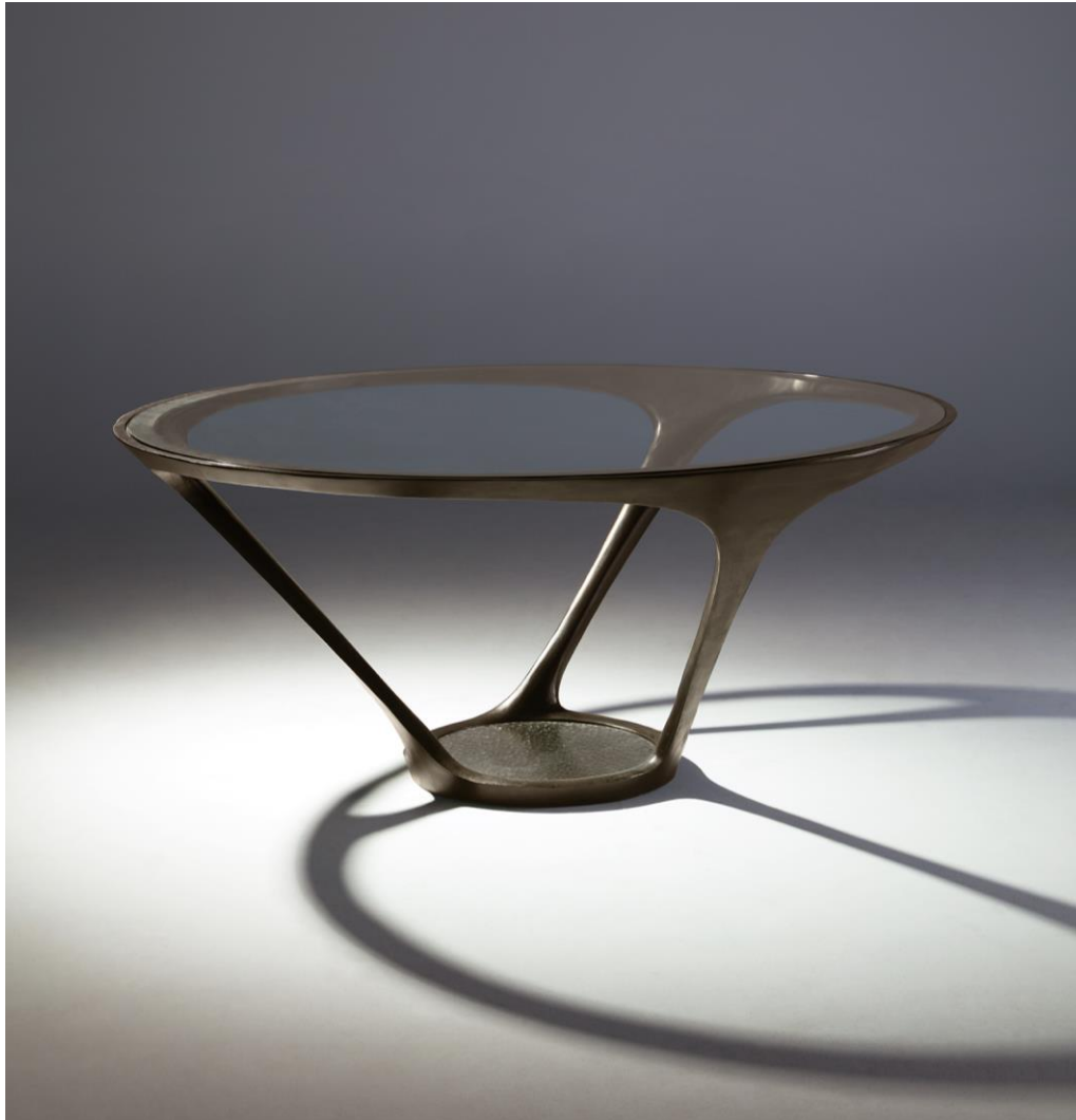
Table repas Bronze doré - Dining table gold bronze - Mesa de comedor bronce dorado