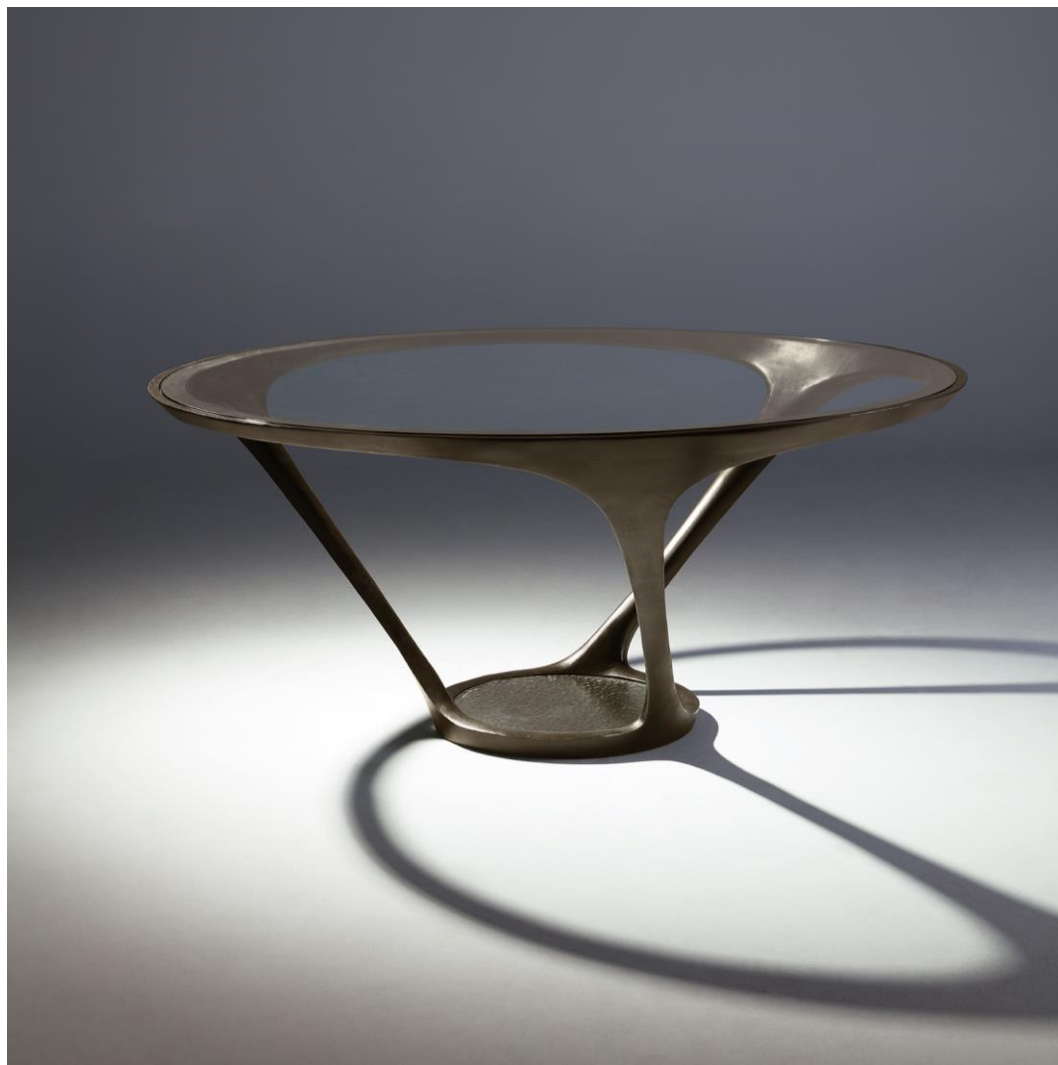
Table repas Bronze doré - Dining table gold bronze - Mesa de comedor bronce dorado