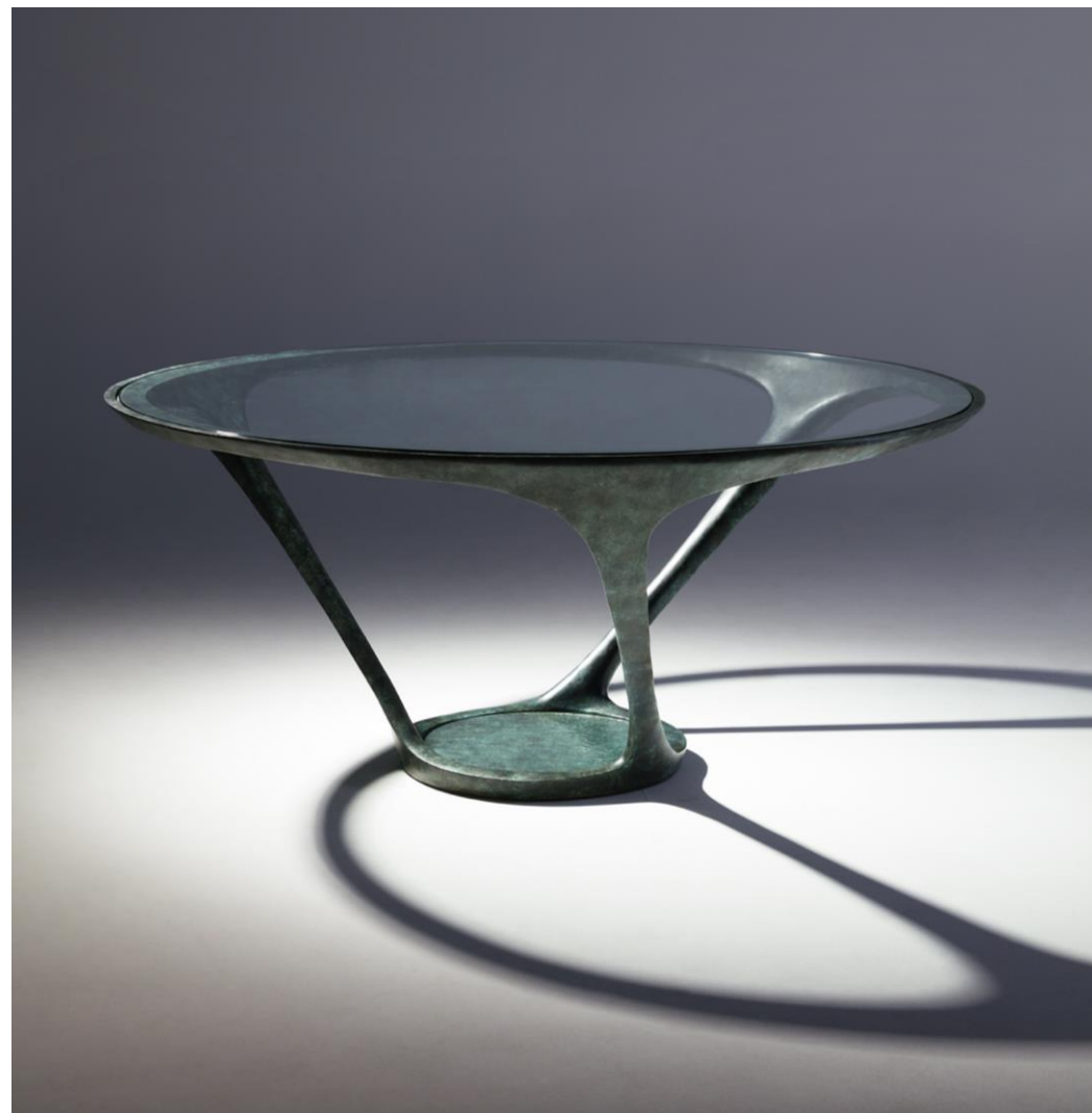
Table repas vert antique - Dining table antique green - Mesa de comedor verde antiguo