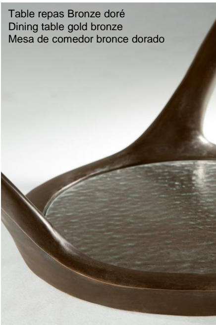
Table repas Bronze doré Dining table gold bronze Mesa de comedor bronce dorado