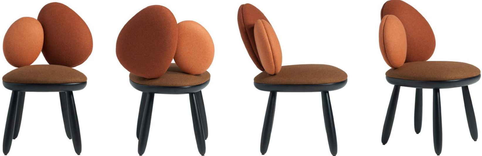
Chaise - Chair - Sedia - Silla