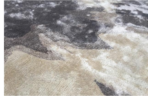
détail – detail – detalle