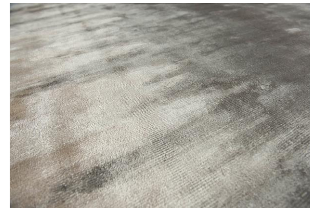
détails – details – detalles