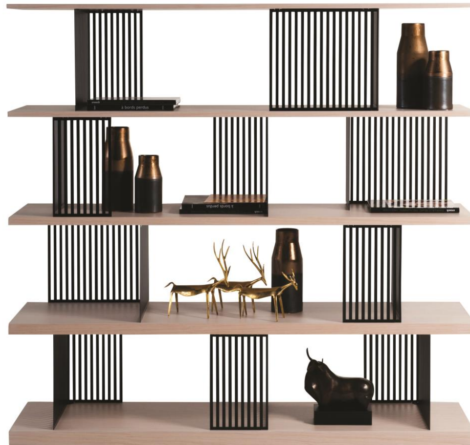
Bibliothèque double face - Double-sided bookcase - Biblioteca con doble frontal