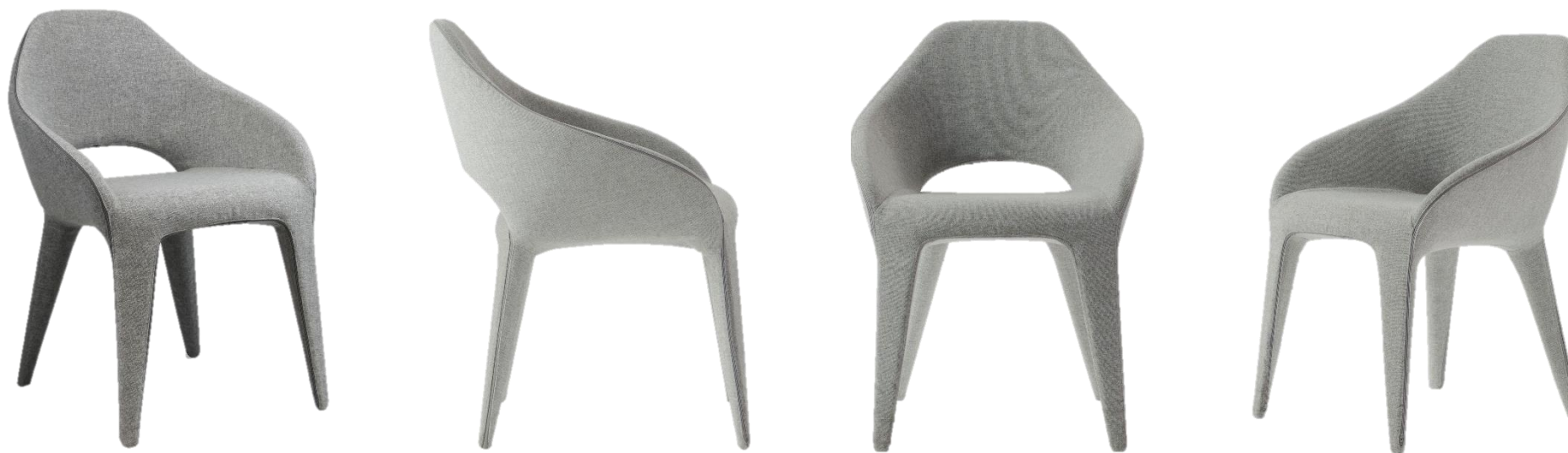
Bridge - Dining armchair - Bridge