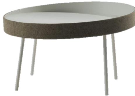
Bout de Canapé - End Table - Mesa de rincón