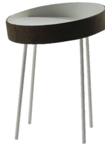
Desserte - Occasional Table - Mesita auxiliar