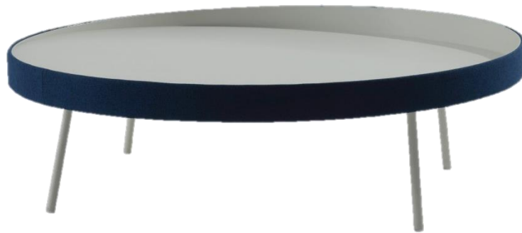
Table basse - Cocktail table - Mesa de centro