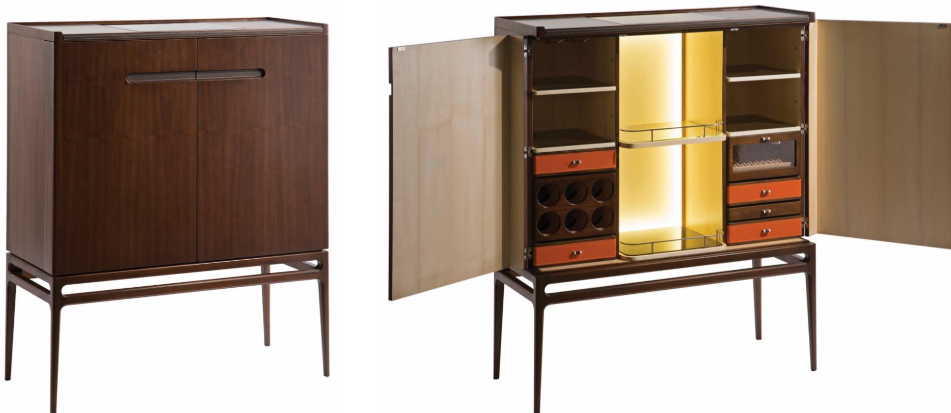
Cabinet bar – Bar cabinet – Cabinete bar