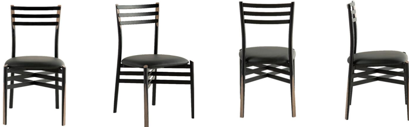
Chaise - Chair - Silla