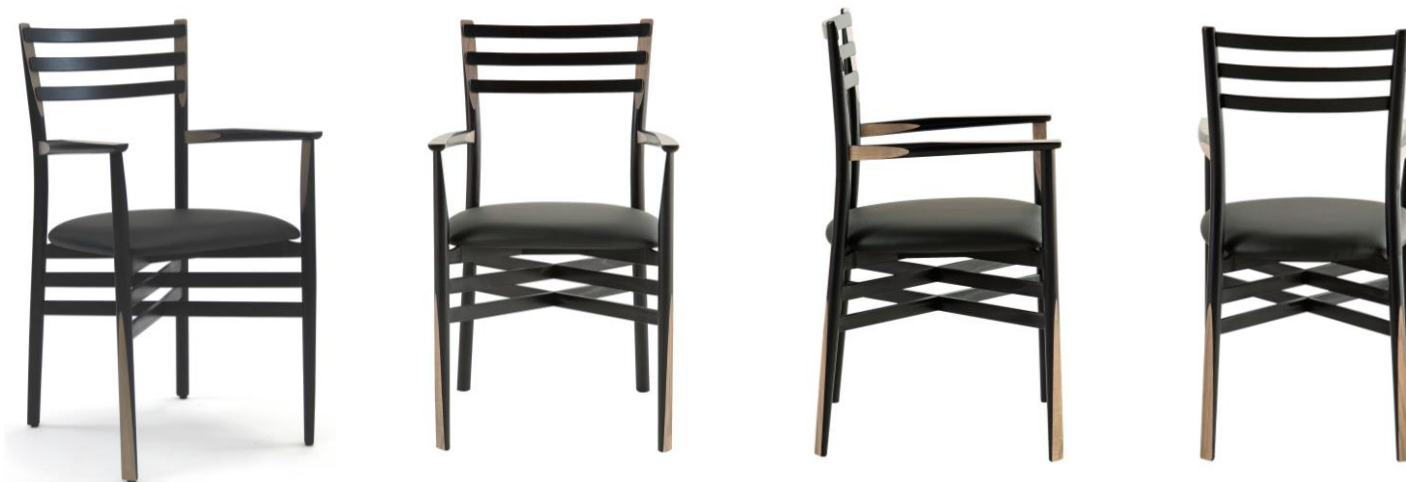
Bridge - Dining Armchair - Bridge