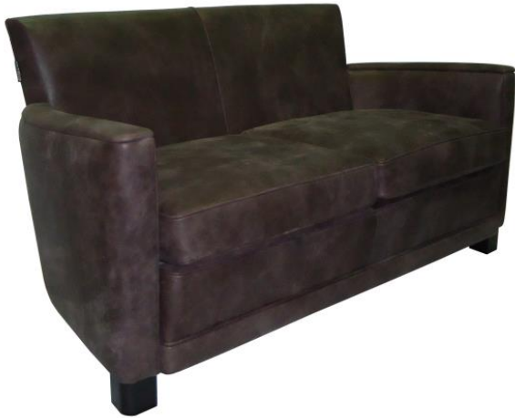
Canapé 1 places ½ PM : L.129 x H.68 x P.76 cm Small 1.5-seat sofa: L.129 x H.68 x D.76 cm Sofá 1 plazas ½ PM : L.129 x H.68 x P.76 cm

Structure : hêtre massif et multiplis Suspensions : ressorts biconiques et façade suspendue. Garnissage : assises mousse HR 42AR et ouate 250 gr/m2 Garnissage : dossiers et accoudoirs mousse HR 23E Piètement : hêtre finition Wengé Habillage : cuir savane taureau fleur rectifiée, nubuck, patinée et vieillie à la main Fabrication Européenne.