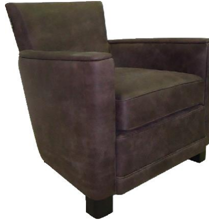
Fauteuil PM : L.69 x H.68x P.76 cm Small armchair: L.69 x H.68x D.76 cm Sillón PM : L.69 x H.68x P.76 cm

Structure : hêtre massif et multiplis Suspensions : ressorts biconiques et façade suspendue. Garnissage : assises mousse HR 42AR et ouate 250 gr/m2 Garnissage : dossiers et accoudoirs mousse HR 23E Piètement : hêtre finition Wengé Habillage : cuir savane taureau fleur rectifiée, nubuck, patinée et vieillie à la main Fabrication Européenne.