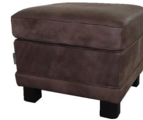
Pouf : L.50 cm x H.41cm x P.50 cm Ottoman: L.50 cm x H.41cm x D.50 cm Puf : L.50 cm x H.41cm x P.50 cm

Structure: solid beech and plywood Suspensions: Bi-conic springs, suspended edge Filling: seat cushion in HR foam 42AR and cotton batting 250 gr/m2 Filling: back cushions in HR foam 23E Base: beech with Wenge-stain finish Upholstery: SAVANE leather, bull leather, corrected grain, nubuck patina finish, aged by hand Manufactured in Europe