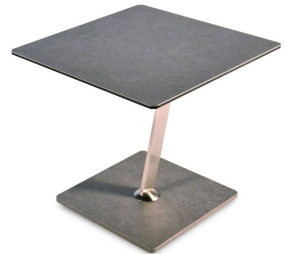
Table basse - Cocktail Table - Tavolino - Mesa de Centro