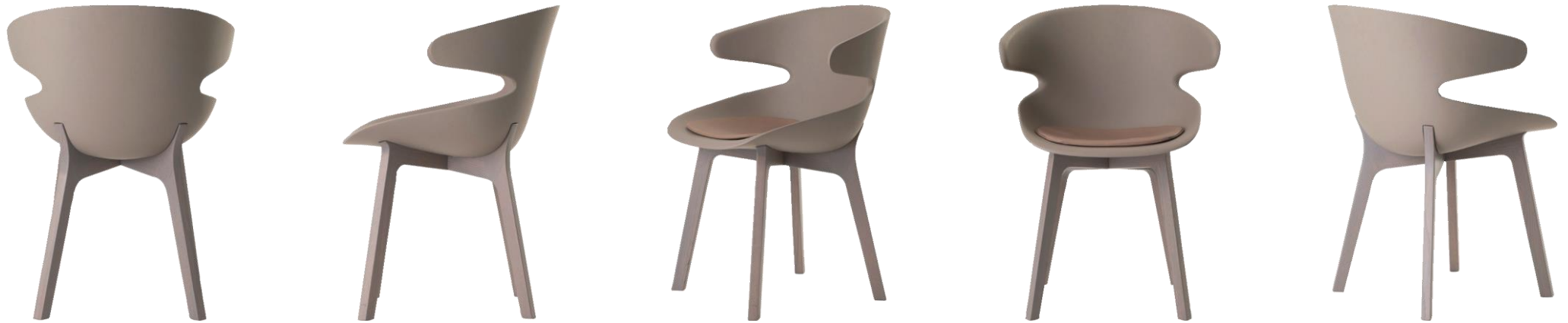
Chaise - Chair - Silla