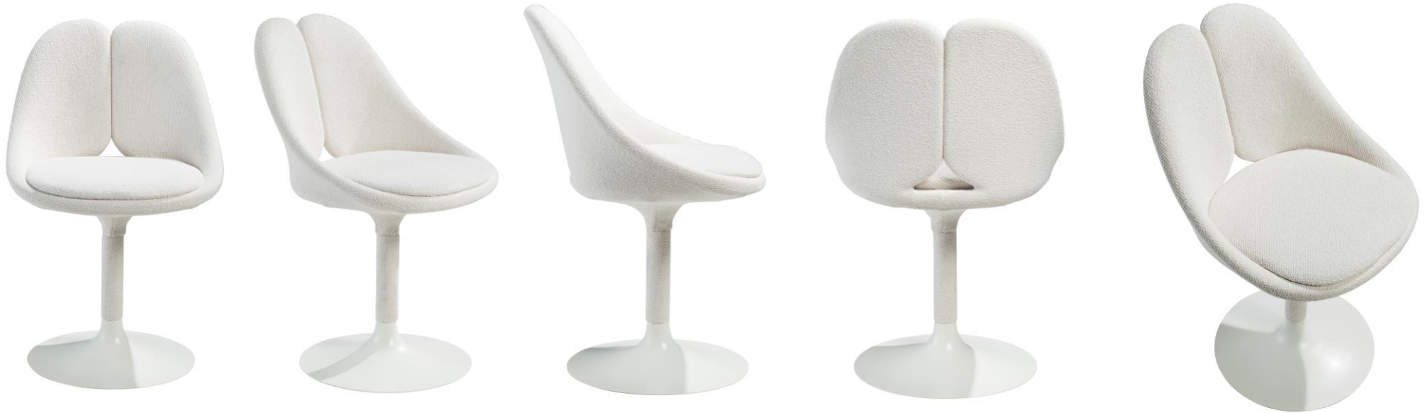
Chaise - Dining chair - Silla Tige revêtue – Coated support – Barra revestida