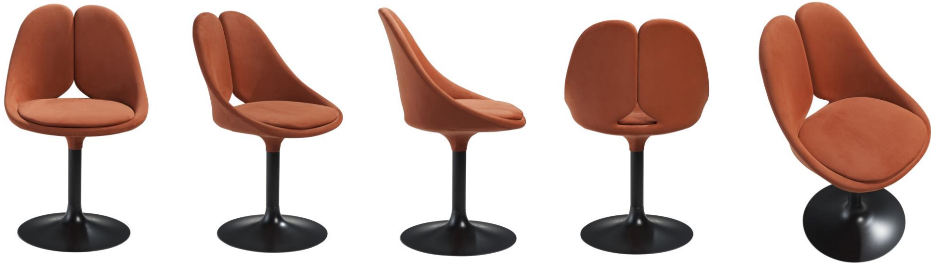
Chaise - Dining chair – Silla Tige laquée – Lacquered support – Barra lacada