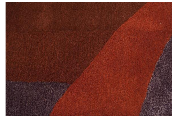
détails – details – detalles