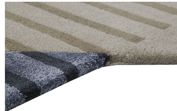
détails – details – detalles