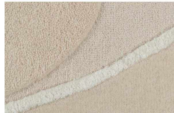
détails – details – detalles