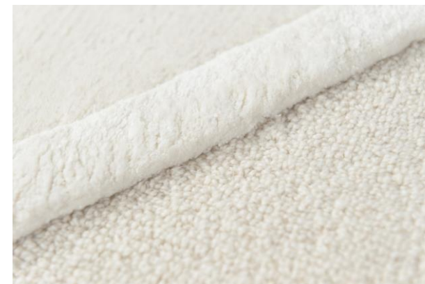
détails – details – detalles