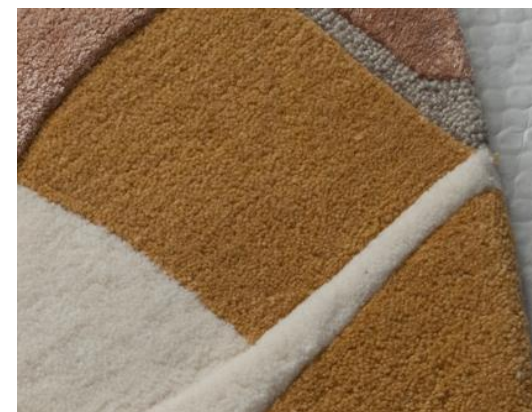
détails – details – detalles