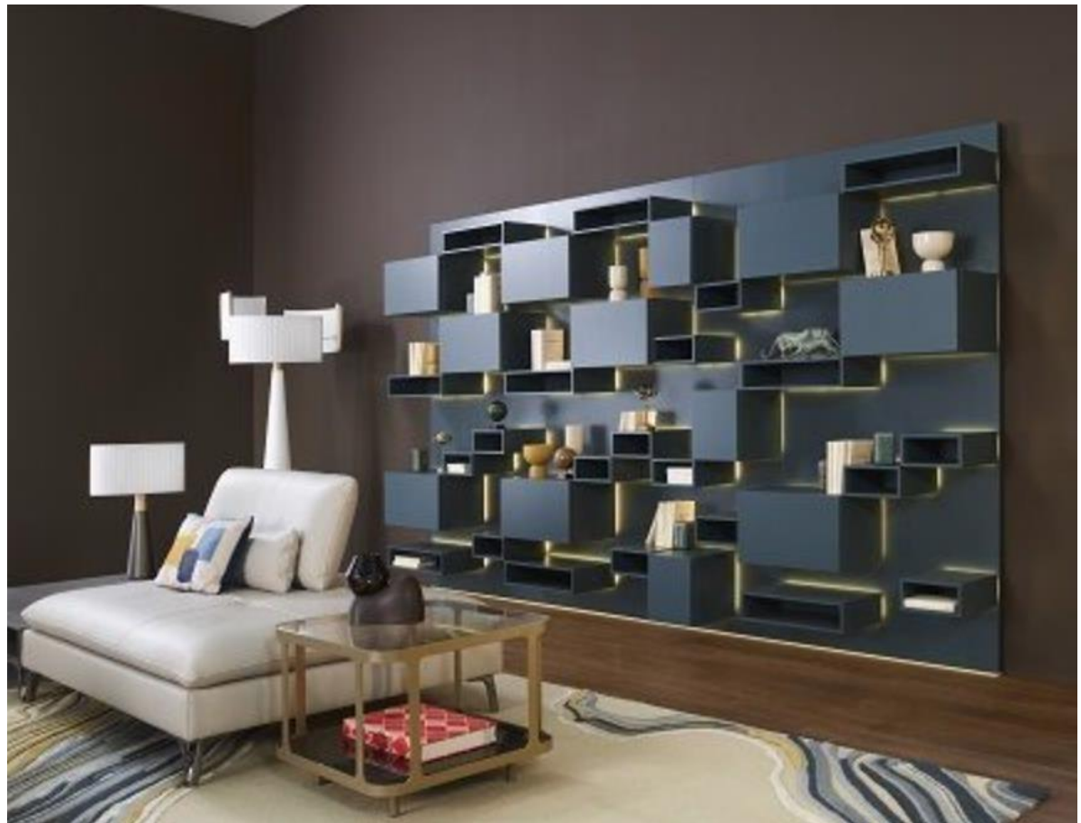
Bibliothèque – Bookcase - Biblioteca