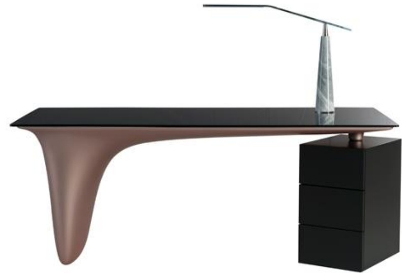
Bureau - Desk - Despacho