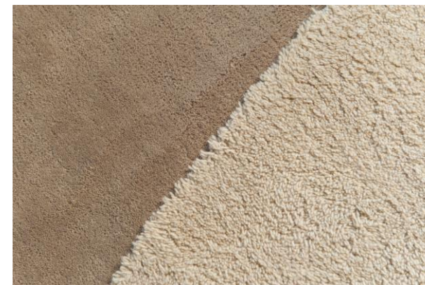
détails – details – detalles