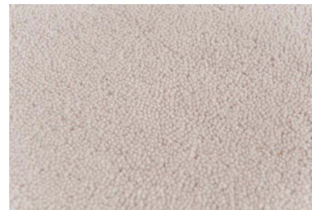
détails – details – detalles