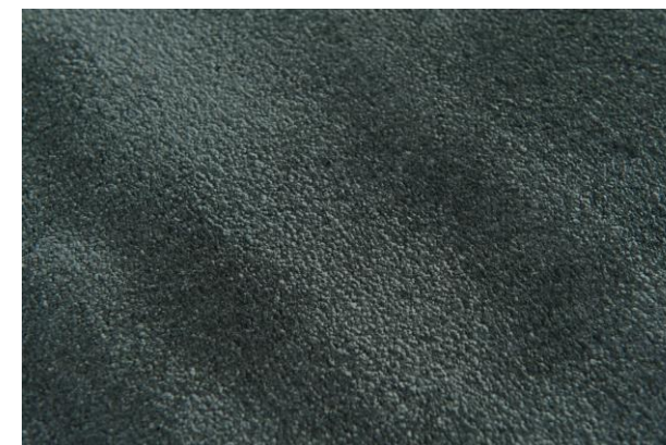
détails – details – detalles