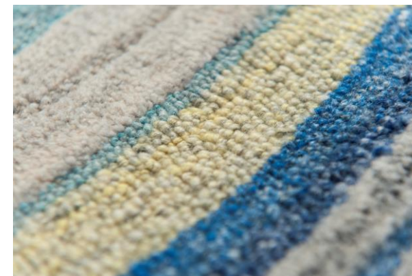
détails – details – detalles