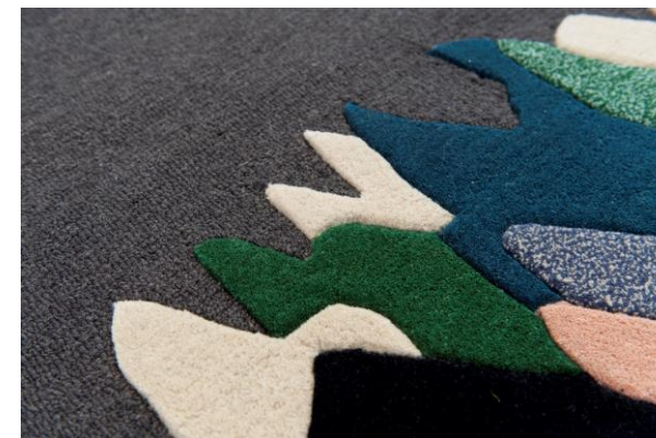
détails – details – detalles