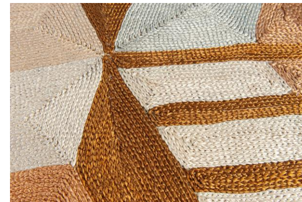
détails – details – detalles