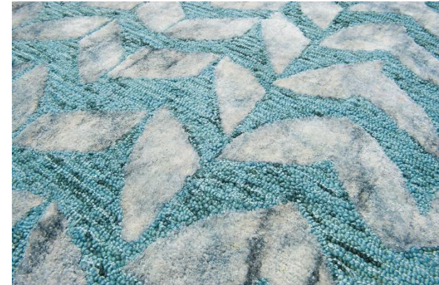
détail – detail – detalle