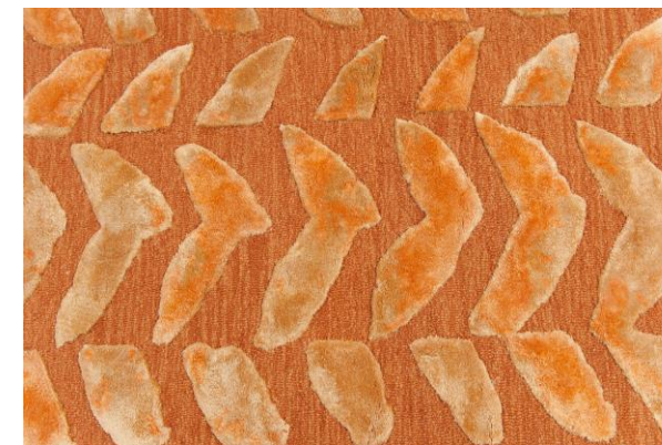
détails – details – detalles