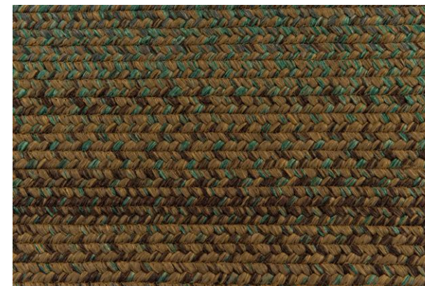
détails – details – detalles