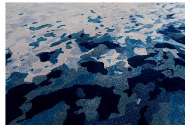
détails – details – detalles

Alfombra anudada a mano en 60% seda vegetal y 40% lana. 9 colores de hilo, peso: 4,3 kg / m 2 Tamaños estándar: 200x300cm y 250x350cm . Posible personalización: tamaño, forma y colores.