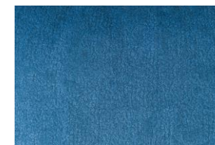
Dos / Back / Dorso

Cojines de ante con ribete negro en 100% poliéster. Cara: patrón estampado tomado de la alfombra Shinchuu. Dorso: estampado uni azul con efecto jaspeado. Dimensiones estándar: 40x68cm, 45x45cm y 20x45cm.. Fabricación francesa. Funda de cojín lavable a máquina a 30 °C.