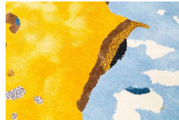
détails – details – detalles