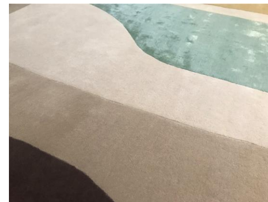
détail – detail – detalle