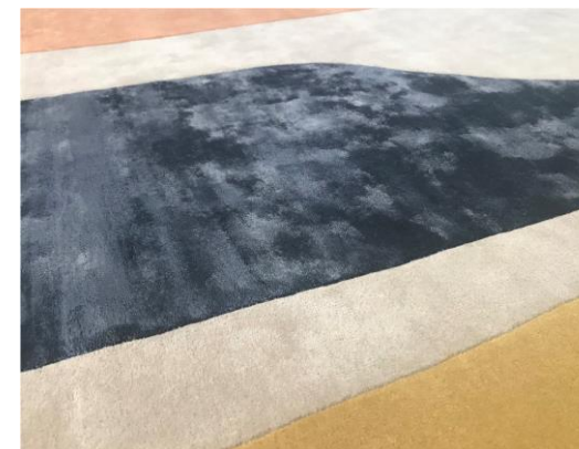
détail – detail – detalle