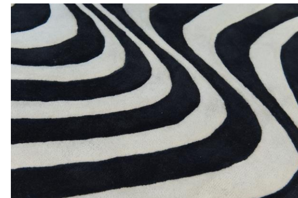
détails – details – detalles