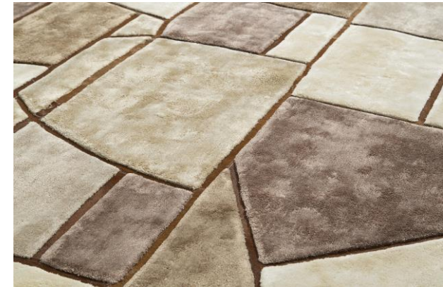
détails – details – detalles