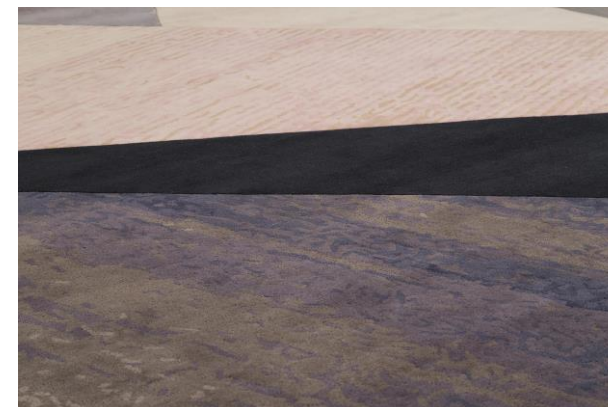
détails – details – detalles